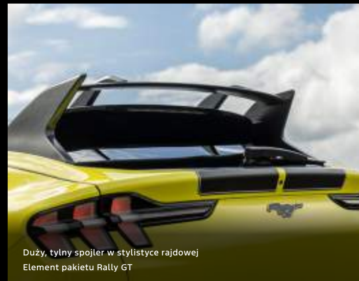
Duży, tylny spojler w stylistyce rajdowej Element pakietu Rally GT

Ford Mustang Mach-E w wersji GT z pakietem GT Rally Kolor nadwozia: Grabber Yellow (bez dopłaty z pakietem Rally GT)