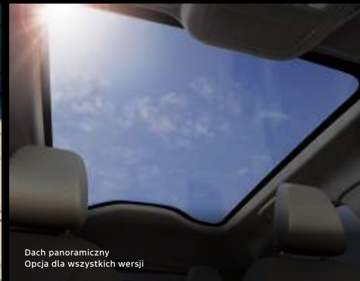
Dach panoramiczny Opcja dla wszystkich wersji

Ford Mustang Mach-E w wersji Premium Kolor nadwozia: Lucid Red (bez dopłaty)