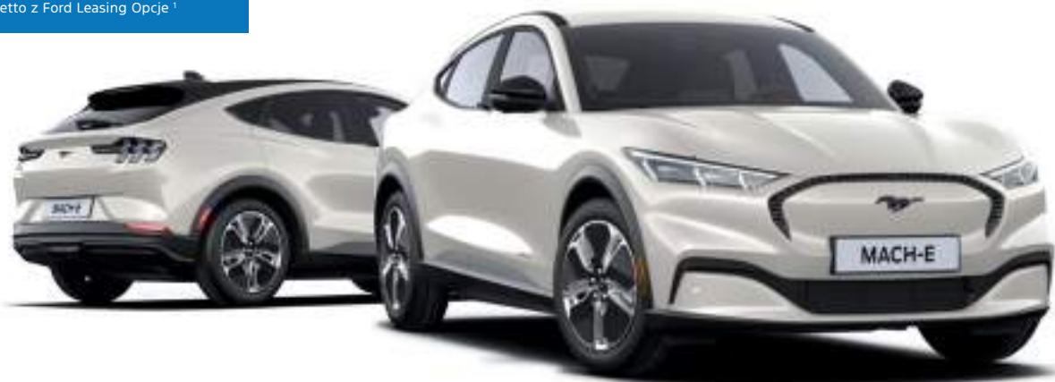
Ford Mustang Mach-E w wersji Mach-E z lakierem metalizowanym specjalnym Star White (opcja)