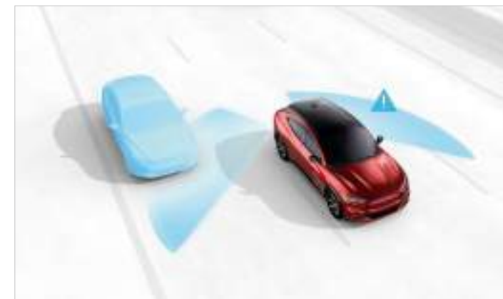
BLIND SPOT INFORMATION - SYSTEM MONITOROWANIA MARTWEGO POLA WIDZENIA W LUSTERKACH Standard dla wszystkich wersji