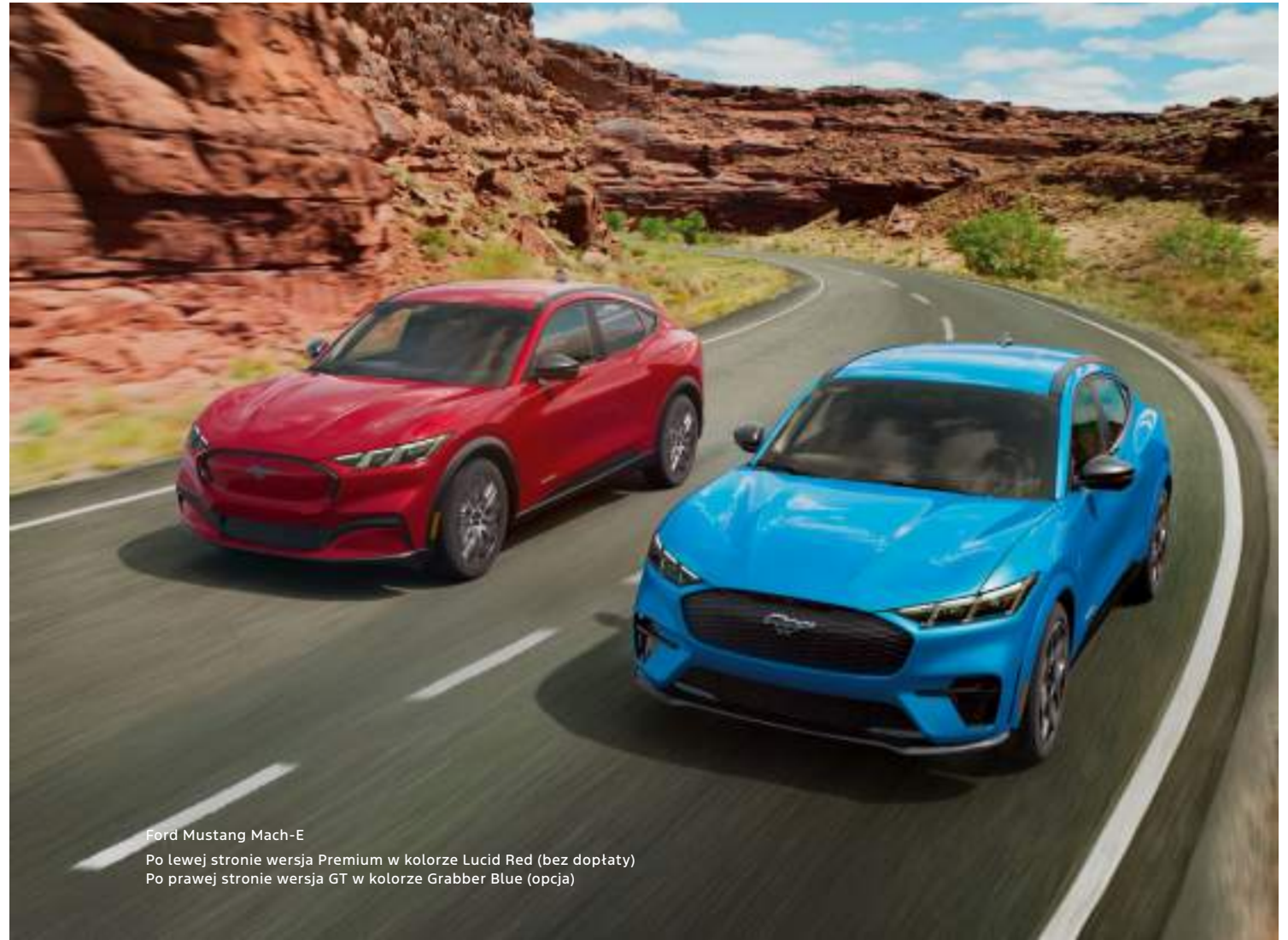
Ford Mustang Mach-E Po lewej stronie wersja Premium w kolorze Lucid Red (bez dopłaty) Po prawej stronie wersja GT w kolorze Grabber Blue (opcja)