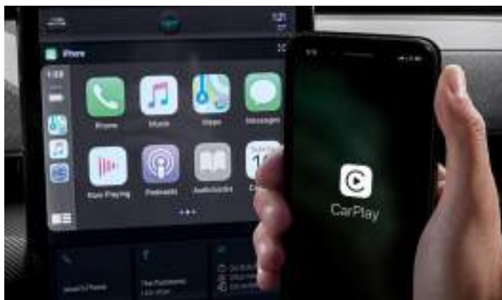
BEZPRZEWODOWA OBSŁUGA APPLE CARPLAY I ANDROID AUTO Standard dla wszystkich wersji. Wymaga kompatybilnego urządzenia.