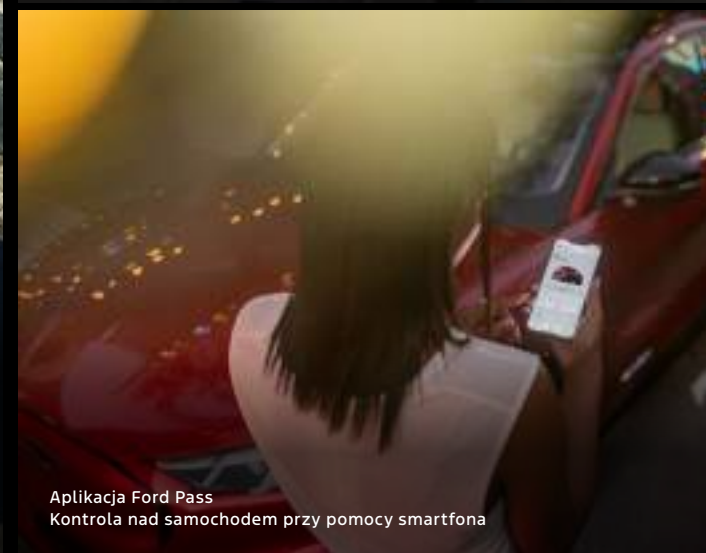
Aplikacja Ford Pass Kontrola nad samochodem przy pomocy smartfona