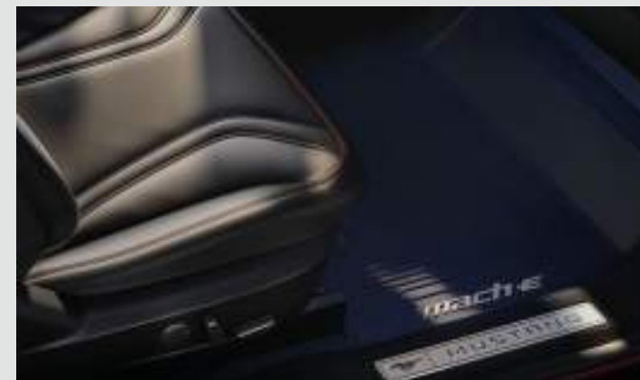
DYWANIKI PODŁOGOWE, GUMOWE PRZÓD I TYŁ, CZARNE (2 526 938) KOMPLET (4 sztuki) | 998 zł