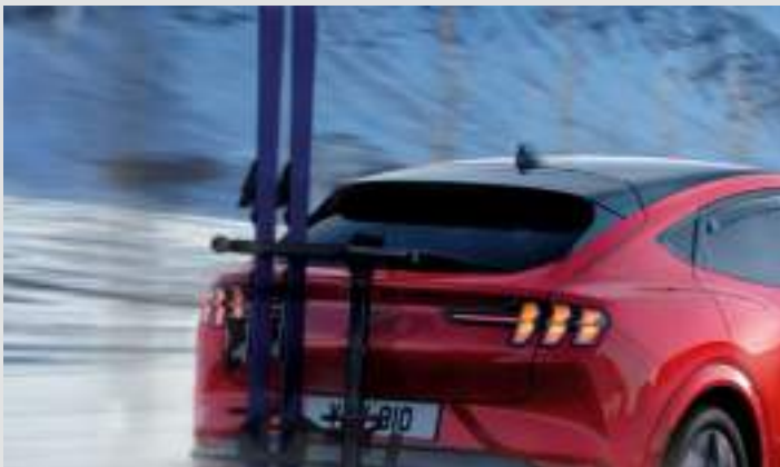
UCHWYT NA NARTY MOTTEZ® - MONTOWANY DO HAKA HOLOWNICZEGO (2 483 279)