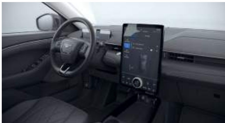
Ford Mustang Mach-E w wersji Mach-E z tapicerką częściowo skórzaną - skóra ekologiczna Sensico (standard)