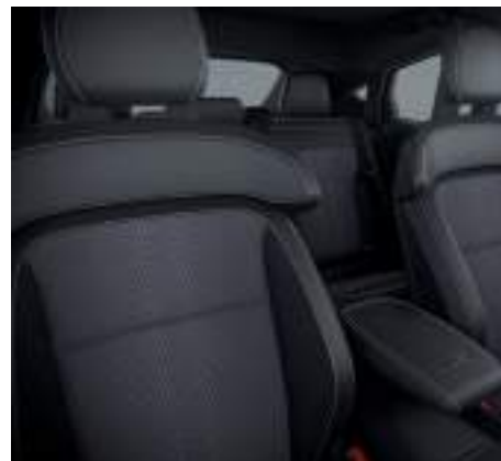
Ford Mustang Mach-E w wersji GT z fotelami kubełkowymi Ford Performance oraz tapicerką Miko Suede połączoną ze skórą ekologiczną Sensico (standard)