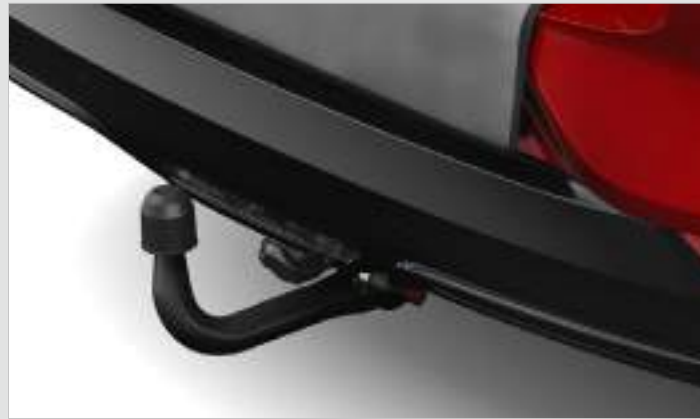
HAK HOLOWNICZY - ODŁĄCZANY (2 616 493)