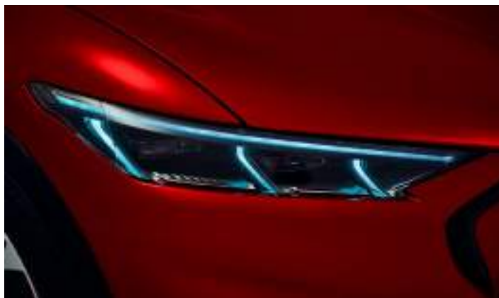
REFLEKTORY PROJEKCYJNE LED Standard dla wersji PREMIUM i GT