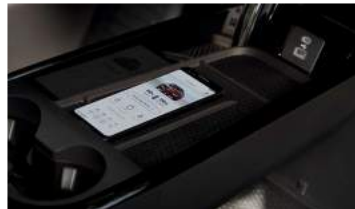
ŁADOWARKA BEZPRZEWODOWA DO SMARTFONÓW Standard dla wszystkich wersji