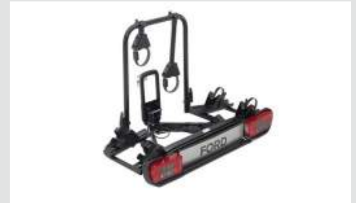
UCHWYT NA DWA ROWERY ATERA® - MOCOWANY DO HAKA HOLOWNICZEGO (2 756 542)