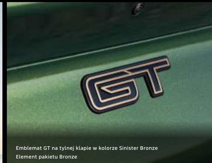
Emblemat GT na tylnej klapie w kolorze Sinister Bronze Element pakietu Bronze

Ford Mustang Mach-E w wersji GT z pakietem Bronze Kolor nadwozia: Eruption Green (opcja)