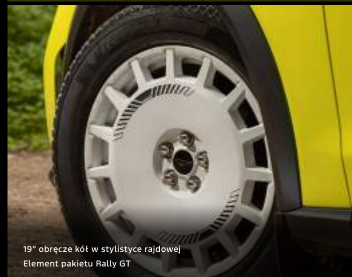
19" obręcze kół w stylistyce rajdowej Element pakietu Rally GT