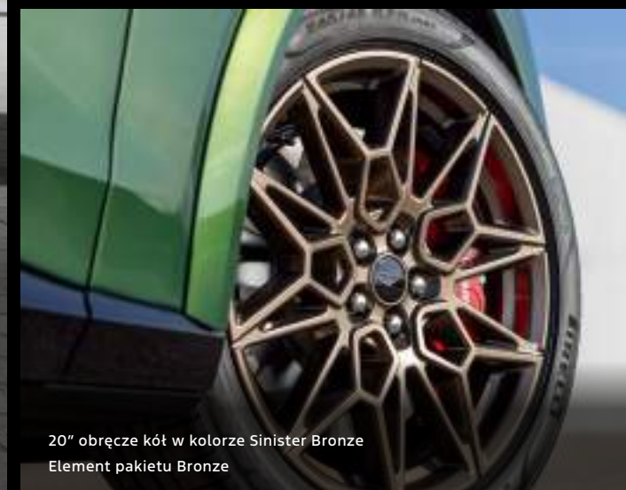
20" obręcze kół w kolorze Sinister Bronze Element pakietu Bronze