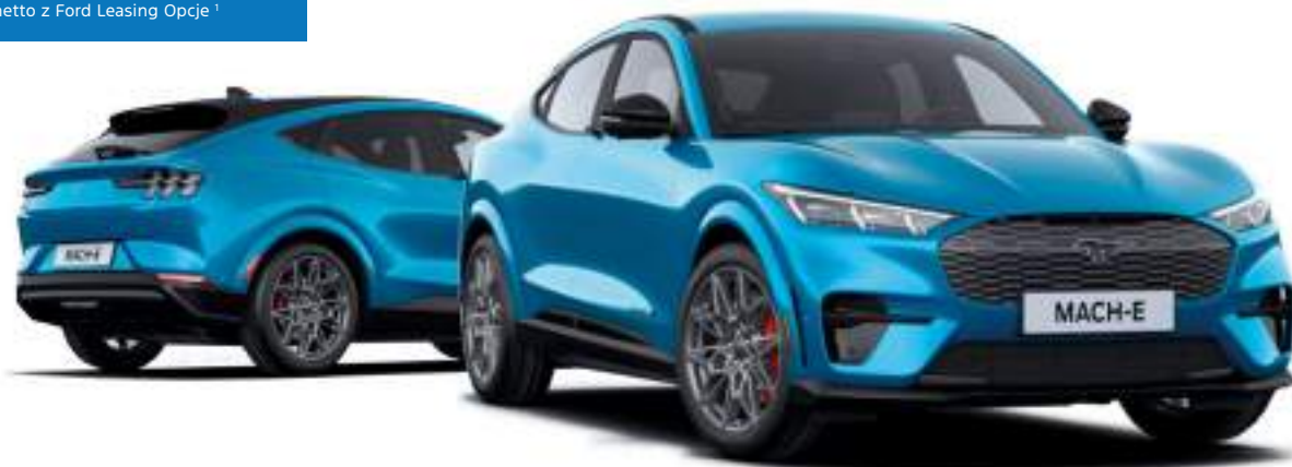
Ford Mustang Mach-E w wersji GT z lakierem metalizowanym Grabber Blue (opcja)