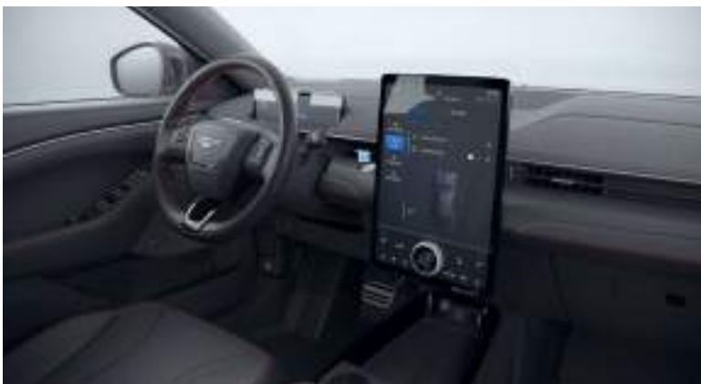
Ford Mustang Mach-E w wersji Premium z tapicerką częściowo skórzaną z czerwonymi akcentami - skóra ekologiczna Sensico (standard)