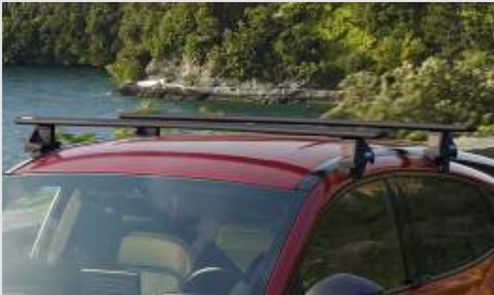
THULE® BAGAŻNIK DACHOWY PODSTAWOWY Z ZESTAWEM 2 DRAŻKÓW POPRZECZNYCH (2 678 170)