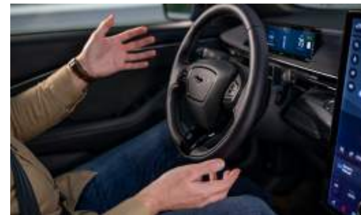
FORD BLUE CRUISE - POZWALA ZDJĄĆ RĘCE Z KIEROWNICY NA WYBRANYCH ODCINKACH AUTOSTRAD Opcja dla wszystkich wersji