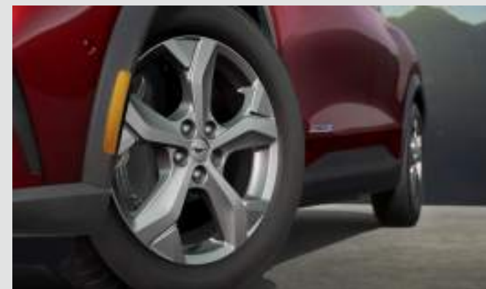
18" KOMPLETNE KOŁA ZIMOWE, ALUMINIOWE Z CZUJNIKAMI CIŚNIANIA OPONY: BRIDGESTONE BLIZZAK LM005, 225/60 R18 104V XL (2 773 535) KOMPLET (4 sztuki) | 7 920 zł

Ford Mustang Mach-E w wersji Premium z opcjonalnym wyposażeniem Kolor nadwozia: Lucid Red (bez dopłaty)