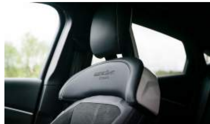
WYKOŃCZENIEM FOTELE W KOLORZE SILVERCITY Standard z pakietem GT Rally