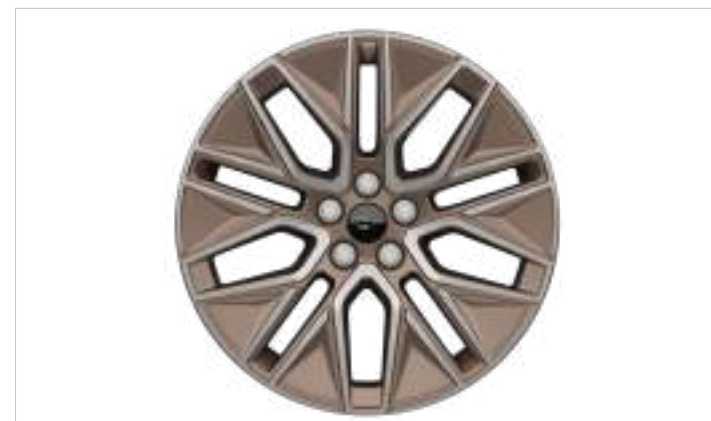
19" OBRĘCZE KÓŁ ZE STOPÓW LEKKICH W KOLORZE BRONZE Opcja dla wersji Premium