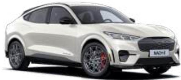
STAR WHITE - LAKIER METALIZOWANY SPECJALNY 4 200 zł