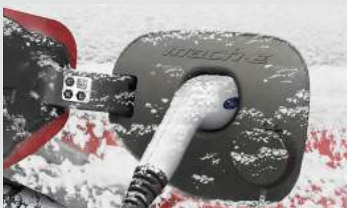
OSŁONA PORTU ŁADOWANIA (2 630 165)