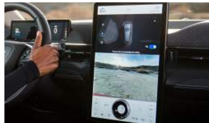
SYSTEM KAMER 360 STOPNI Standard dla wszystkich wersji