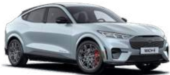
GLACIER GREY - LAKIER METALIZOWANY 4 200 zł Lakier niedostępny w połączeniu z pakietem Bronze