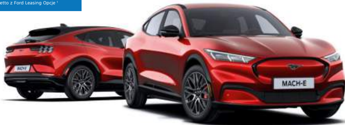
Ford Mustang Mach-E w wersji Premium z lakierem metalizowanym specjalnym Lucid Red (bez dopłaty)